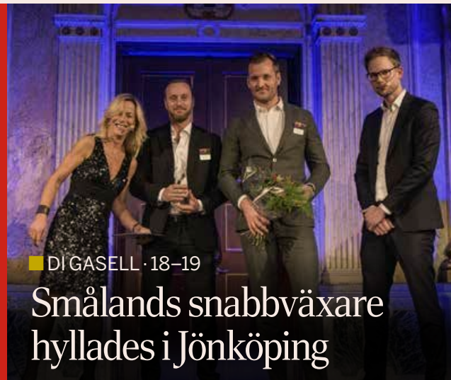
■ DI GASELL · 18–19

Smålands snabbväxare hyllades i Jönköping